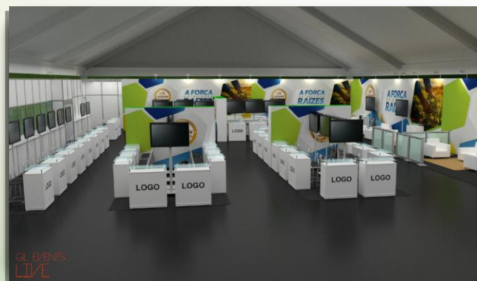
Hubs – imagens ilustrativas