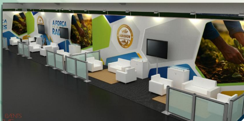
Lounge patrocinadores – imagens ilustrativas